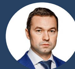
А.Л. Мальцан Заместитель министра инвестиций, промышленности и науки Московской области