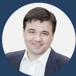
А.Ю. Воробьев Губернатор Московской области