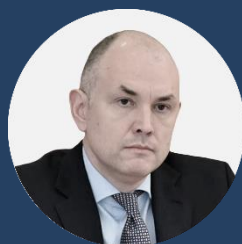
И.Н. Габдрахманов Первый Вице-губернатор Московской области — Председатель Правительства Московской области